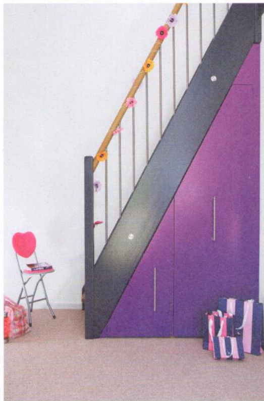
Dieser Treppenunterschrank nimmt die Steigung der Treppe harmonisch auf. Bedingt durch den Schrägdeckel wirkt er wie aus einem Guss. www.deinSchrank.de