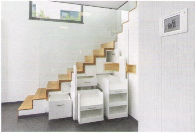
Ein Treppenunterbau mit verblüffender technischer Raffinesse: Hinter den gestuften Drehtüren befinden sich ausziehbare Schubkästen. In geschlossenem Zustand weist nichts auf die Einbauten hin. www.luxhaus.de