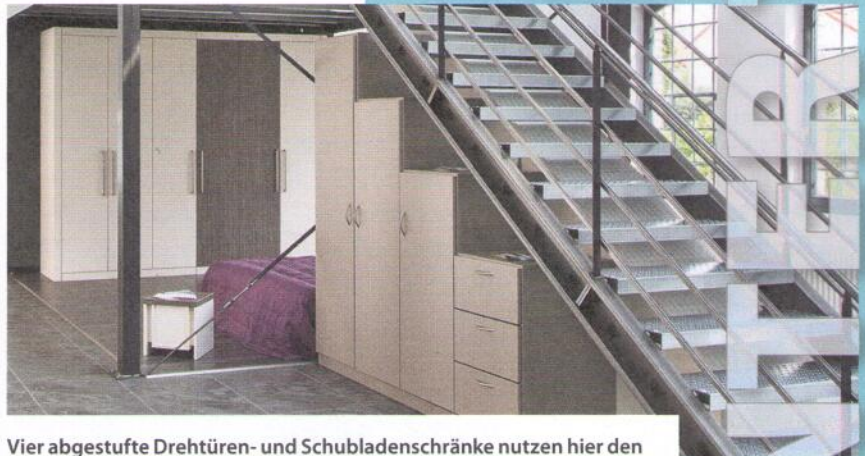
Vier abgestufte Drehtüren- und Schubladenschränke nutzen hier den Raum unter der Treppe so gut wie möglich aus. Die Schrankdeckel bieten zusätzliche Ablagemöglichkeiten. www.deinSchrank.de